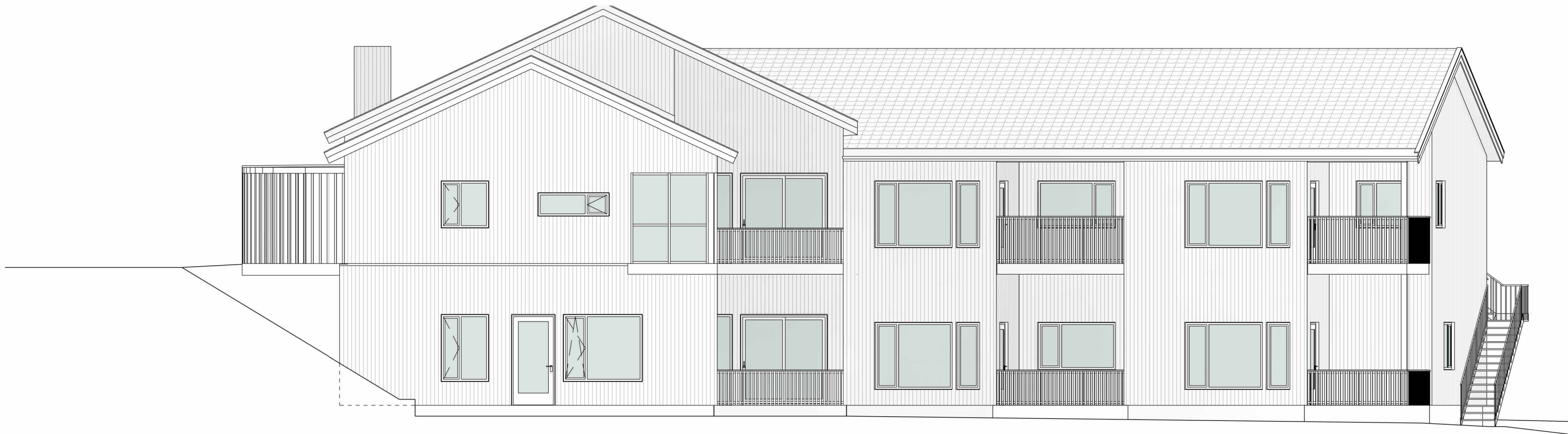
Fasade sørvest 1 : 100