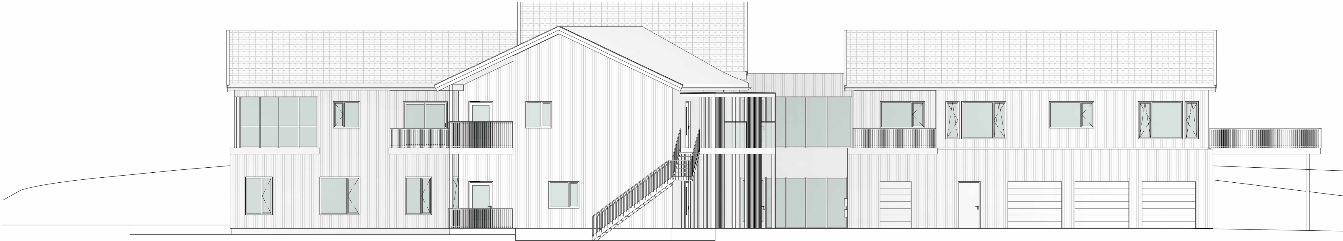
Fasade sørøst 1 : 100