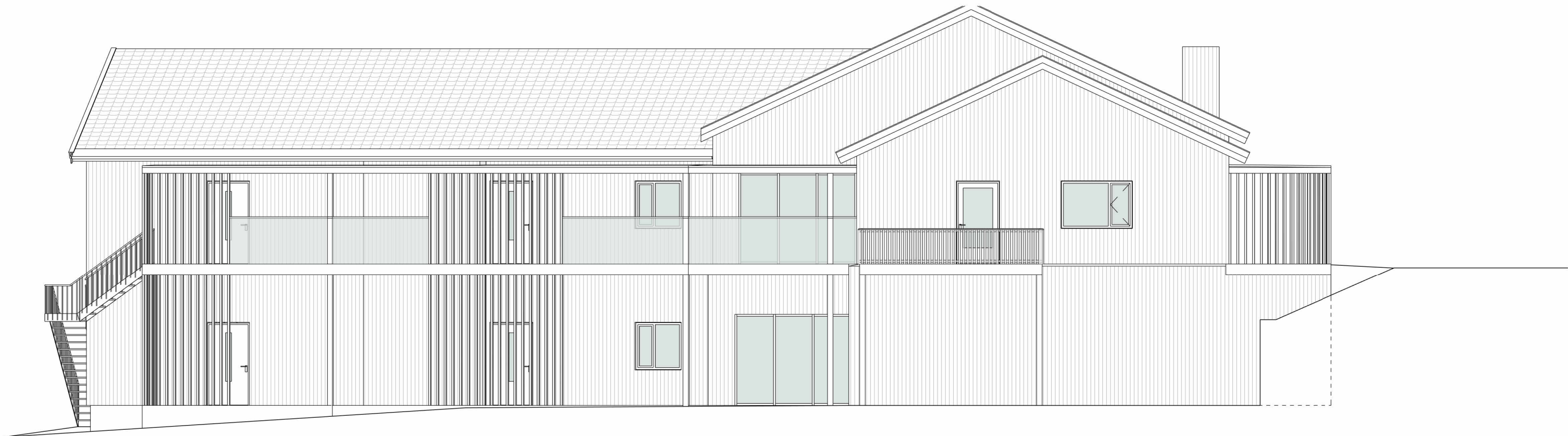
Fasade nordøst 1 : 100